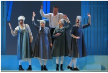
„Ponas Puntila ir jo tarnas Matis“, rež. Algis Pociūnas.

„Aš esu ligonis (...) Aš sergu priepuoliais. Nėra ko čia šaipytis, žmogau. Mažiausiai kartą per mėnesį. Pabundu ir netikėtai pasijuntu blaivutėlis, it išvarvėjusi statinė (...) Yra taip: diena iš dienos esu visiškai normalus, toks, kokį dabar mane matai, pilną dvasios pajėgų ir pajutimų stiprybėj. Staiga prasideda priepuolis. Visų pirma sutrinka regėjimas (...), bet tai dar ne galas: aš tampu, įsivaizduok, atsakingas už veiksmus. Ar tu supranti, brole, ką